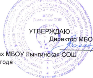
График проведения оценочных процедур в 5-9 классах МБОУ Лынгинская СОШ 1 четверть 2023/2024 учебного года